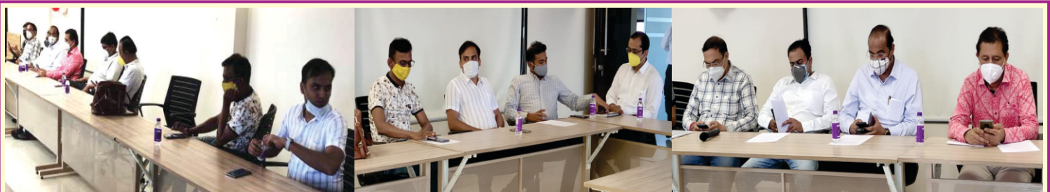
OB Members, Committee Convener & Co-convenor attending GB Meeting